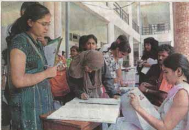
ಪ್ರಥಮ ಪಿಯುಸಿ ಸೇರ್ಪಡೆಗಾಗಿ ನಗರದ ಮೆಂಟ್ ಕಾರ್ಮಿಕ್ ಕಾಲೇಜಿನಲ್ಲಿ ವಿದ್ಯಾರ್ಥಿಗಳು ಆರ್ಜಿ ಸಲ್ಲಿಸುತ್ತಿರುವ ದೃಶ್ಯ. ಬುಕ್‌ವಾರ್ ಕಂಡು ಬಂತು - ಪ್ರಜಾವಾಣಿ ಚಿತ್ರ

'ಈ ವರ್ಷ ಆನ್‌ಲೈನ್ ಆರ್ಜಿ ಸ್ವೀಕಾರ ವ್ಯವಸ್ಥೆ ಪಾರಾಗಿ ತಂದಿರುವುದರಿಂದ ಕಾಲೇಜುಗಳಿಗೆ ಒಂದು ವರ್ಷ ಸಂಸ್ಥೆ ಕಡಿಮೆಯಾಗಿದೆ. ಕಳೆದ ವರ್ಷ ನಮ್ಮ ಕಾಲೇಜಿನಲ್ಲಿ 12 ಸಾವಿರಕ್ಕೂ ಅಧಿಕ ಆರ್ಜಿಗಳನ್ನು